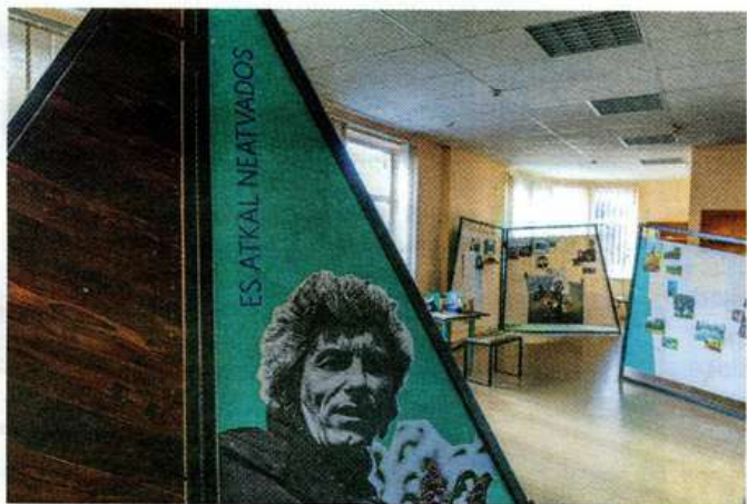
Imanta Ziedoņa Ķemeru bibliotēkā skatāma dzejniekam veltīta izstāde "Es atkal neatvados".

3. maijā plkst. 16.00 Ķemeru pamatskolas zālē (Tukuma ielā 10) norisināsies Augšdaugavas novada teātra trupas "Trešais variants" uzvedums "Ziedonis. Epifānijas", kas veidots pēc Imanta Ziedoņa daiļrades motīviem.