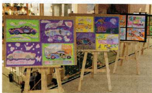
Izstādē ikvienam ir iespēja novērtēt gan mazo, gan arī lielo «Rasas krāsu» audzēkņu izspēnotos «Bugatti»

darbos ir vairāk geometriskā jūgenda iezīmes. Iepriekšējo darbu kolekcijā dominēja augu motīvi ar rasas lāsēm, bet šajā izstādē ir akcents uz koku zaru konstruktīvo ritmu un svečturu veidojuma vairāk jūtamās pasaules tautu ornamentu iezīmes. «Tie ir vairāk stilizēti un geometriski dizaina klasiskai izpratnei – formu vienkāršotībai ar mākslinieciskiem akcentiem. Darbos ir dabiskā dzintara akcenti, kas