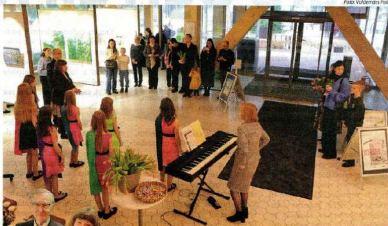
Mirkļis no izstādes «Gaismas vilņošanās» atklāšanas