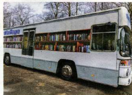
▲ 1980. gadā ražoto bibliobusu 2009. gadā Grobiņas novadam uzdāvināja Ofenbahas pilsētas pašvaldība Vācijā. Arī tur «optiņš» kalpojis šim mērķim.