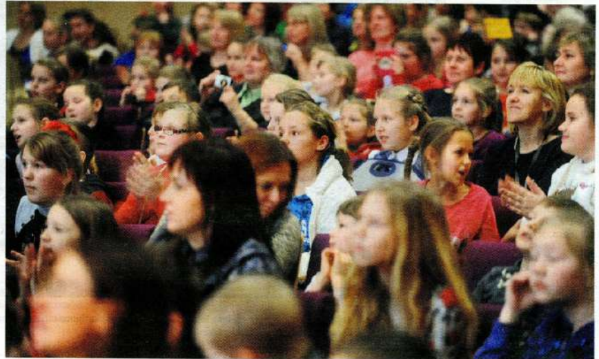
Latvijas Nacionālās bibliotēkas Bērnu literatūras centra rīkotajā lasīšanas veicināšanas programmā "Bērnu, jauniešu un vecāku žūrija" iesaistījušies tūkstošiem dalībnieku visā Latvijā.