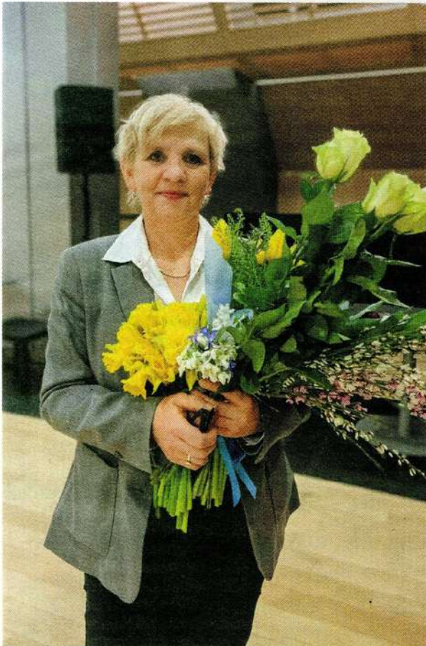
▲ FOTOGRĀFE Klaudija Heinermane savā darbībā galvenokārt pievēršas ilgtermiņa dokumentāliem projektiem un mūsdienu vēstures problēmām.

«ci,» saka vācu fotogrāfe Klaudija Heinermane