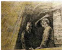
Izstādē skatāmas aptuveni 14 pedējā laikā tapušās Laumas Palmbahas gleznas un grafikas