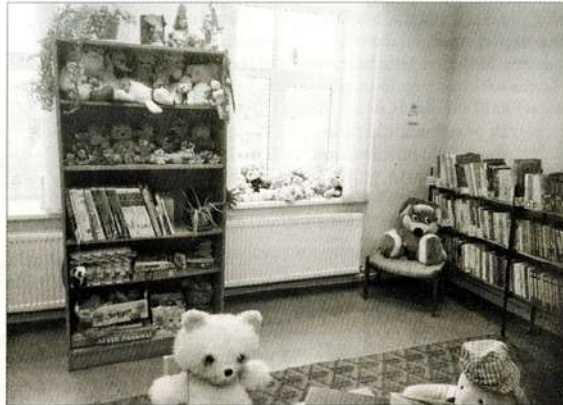
Bibliotēka lepojas ar “lāču” istabu.