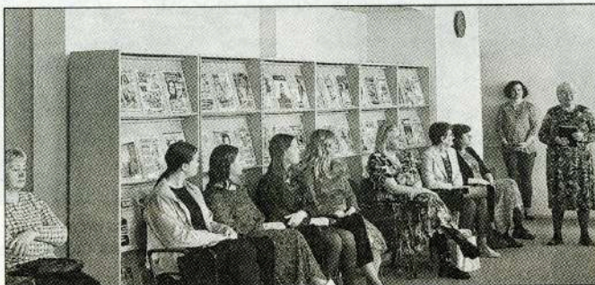
Mirkļi no sarīkojuma Madonas novada bibliotēkā.