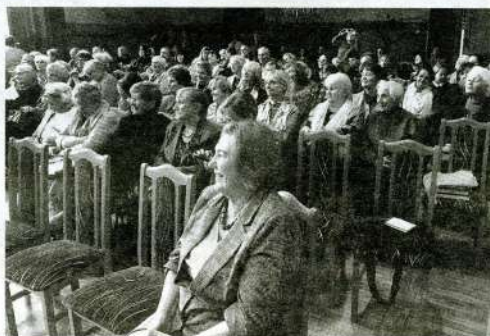
GRĀMATU SVĒTKOS Lielvircavas kultūras nama zālē sanāca ap 170 grāmatu cienītāju.

Muzikāli ar latviešu komponistu dziesmām svētkos izdaiļoja teātrī Zemgales laukos izaugušie Jelgavas Mūzikas vidusskolas audzēkņi.