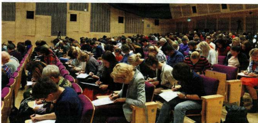
Pērn Pasaules diktātu Latvijas Nacionālās bibliotēkas Ziedoņa zālē rakstīja 1784 dalībnieki.

Savukārt, rakstot diktātu neklātienē, vispirms vietnē