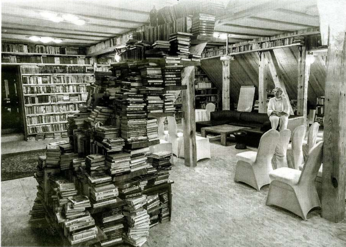
Līgatnes Springšļu dzīrnāvās top izglābto grāmatu bibliotēka. Ļoti atraktīvi uz dižajām kāpnēm izvietotas grāmatas, kuras ar prieku tiek atdotas interesentiem