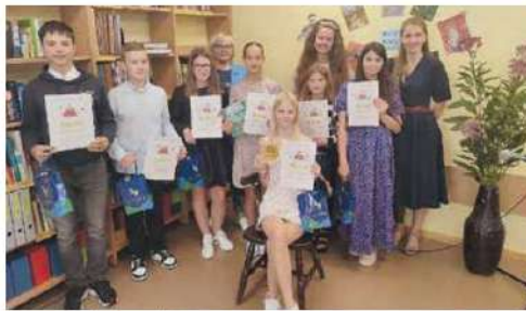
Reģionālajā finālā piedalījās 7 sava novada čempioni.

Paldies visiem dalībniekiem par labi sagatavotiem lasījumiem, skolotājiem par ieguldīto darbu un vecākiem par atbalstu! Visi intere-