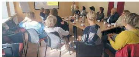
Igaunijas izglītības jomas speciālisti Salaspils novada bibliotēkā.

Vizīte norisinājās Izglītības un zinātnes ministrijas īstenotā Eiropas Savienības Erasmus+ programmas projekta „Nacionālie koordinatori Eiropas programmas ieviešanai Latvijas pieaugušo izglītībā” (projekta numurs Nr. 101051304-NCLV-ERASMUS-EDU-2021-AL-AGENDA-IBA) ietvaros.