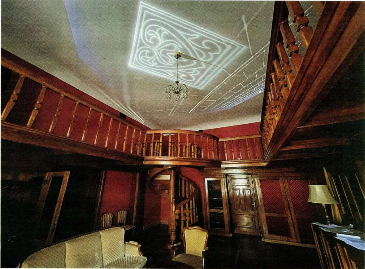
Pelču pils bibliotēkā vakardiena sadzīvo ar šodieni. Telpā ar senu ozolkoka interjeru tagad iekļaujas Stāstu skapji – gaismas projekcijas griestos un arī audiostāsti.

Šodien 14.00 Pelču pils vēsturiskajā bibliotēkā tiek atklāta interaktīva ekspozīcija Stāstu skapji . Kuldīgas novada pašvaldības projektā restaurētas skaistās koka vītņu kāpnes. Te var apskatīt ne tikai seno grāmatu krājumu, bet arī unikālu ozolkoka interjeru un seno centrālpakuri, no kuras pa iebūvētām lūkām savulaik grāmatu skapjos plūdis silts gaiss. Tā ir vienīgā šāda veida saglabātā vieta Latvijā.