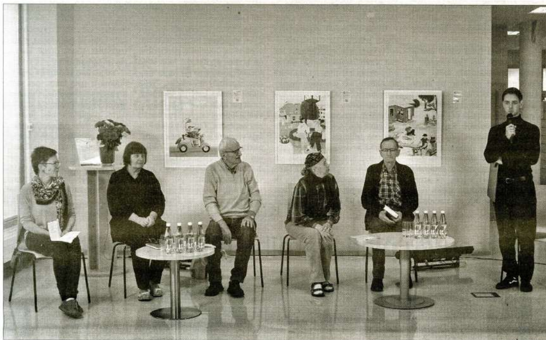
DZEJAS AUTORVAKARS Valmieras integrētajā bibliotēkā ar īpašu pievienoto vērtību – pašu autoru dzejas lasījumiem.