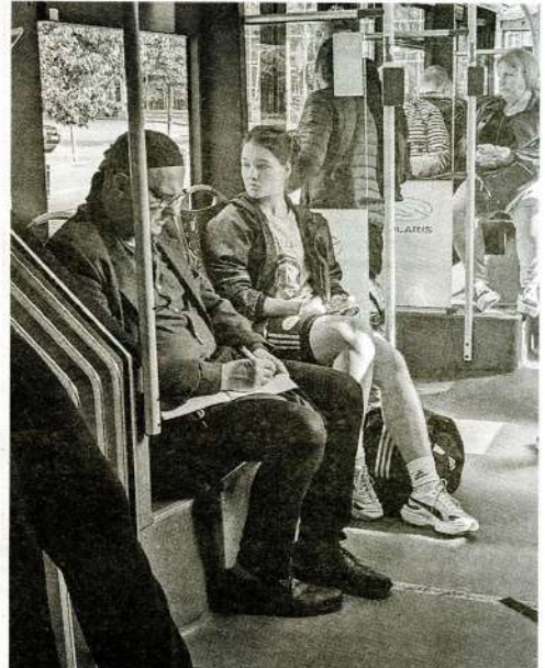
PIERAKSTOT dzejoli ceļā uz darbu.