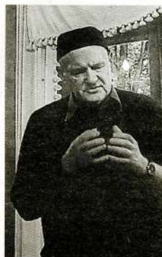
VADOT Jura Kunosa dzejas vakaru Akuratera muzejā.

vijai karu ievilkt. Ukrainā bezjēdzīgi turpina mirt cilvēki. Man šajā brīdī nav impulsa doties uz Ukrainu. Šķiet, vecums liek raudzīties citādi, daudz lielāka vērtība ir arī ģimenei, nevis pasionārisma garām, kas liktu mirt par citu valsti. Bet nav gluži tā, ka es baroju kanārijputniņus brīdī, kad mani sauc uz revolūciju. Esmu viens no PEN kluba aktīvistiem, kas iestājas par