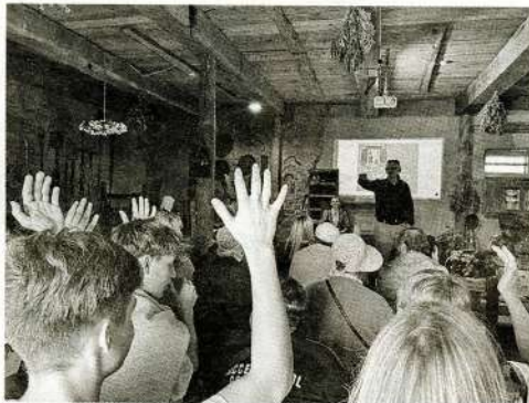
BERĶENELE. Notiek balsošana par to, kura būs kopīgā dzejoļa pirmā rindiņa.