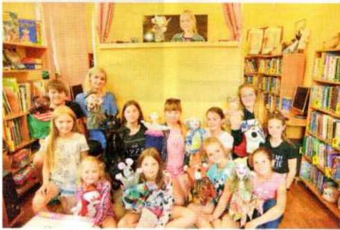
Viņa ievēroja, ka bērni nāk uz bibliotēku, jo te ir iespēja satikties ar draugiem ārpus skolas, te neviens

meitene palūdz atļauju bibliotēkā nosvinēt dzimšanas dienu, jo mamma neļāva saukt draugus uz mājām. “Padomāju – kāpēc nē? Es atļāvu, uzvārtu tēju, meitene atnesa torti, atnāca dažī draugi, kopā nosvinējām, mierīgi, klusi. Šeit, laukos, bērniem bibliotēka ir vieta, kur būt kopā. Galvenais, lai viņi te jūtas ērti, ģimeniski. Bet, kad apkārt vēl ir grāmatām pilni plaukti, var piedāvāt kādu papemt palasīt.”