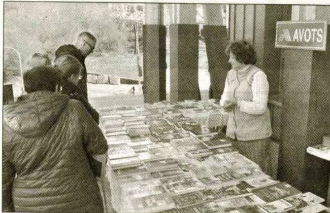
Grāmatu svētki bez iespējas iegādāties lasāmvielu būtu tas pats, kas dzimšanas diena bez tortes.