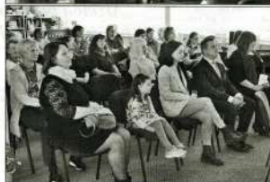
Mirāji no pasākuma.