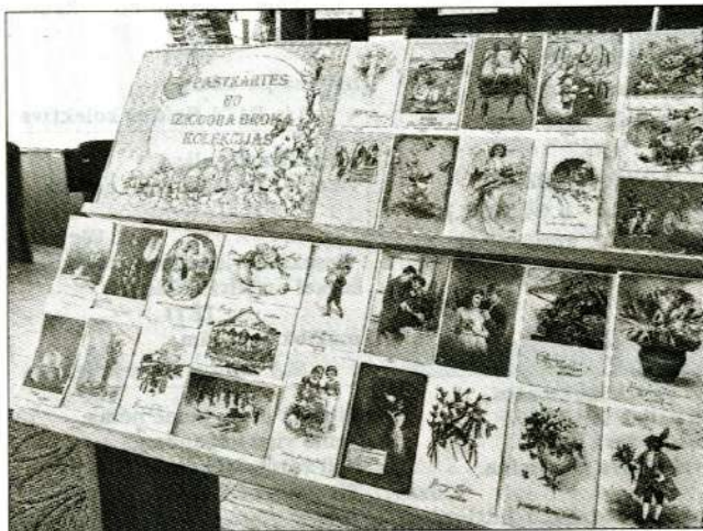
LIELDIENU KARTĪTES NO 20. GADIEM apskatāmas Blīdenes bibliotēkā.