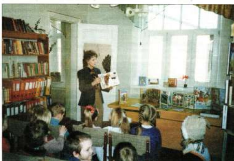
AR MAZAJIEM. Tikšanās bibliotēkas pasākumā.

Viens no manas bērniņas spilgtākajiem piedzīvotiem bija ar velosipēdu brauciens uz Rūjienas bērnu bibliotēku. Dzīvoju netālu no Virķe-