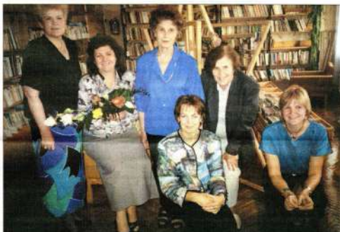
AR KOLEĢIEM.