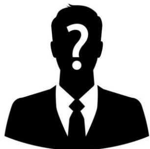
Filozofs, RSU mācībspēks