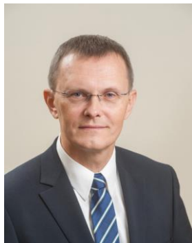
Bijušais Finanšu ministrs