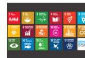
Libraries, Development and the United Nations 2030 Agenda