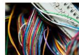
IFLA and the Information Society