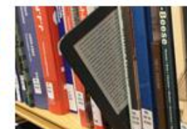
eLending for Libraries